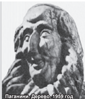
Паганини. Дерево. 1959 год

...Потом Иткинд, разливая по рюмкам «вишневку», хитро прищурил глаза, предложил тост: