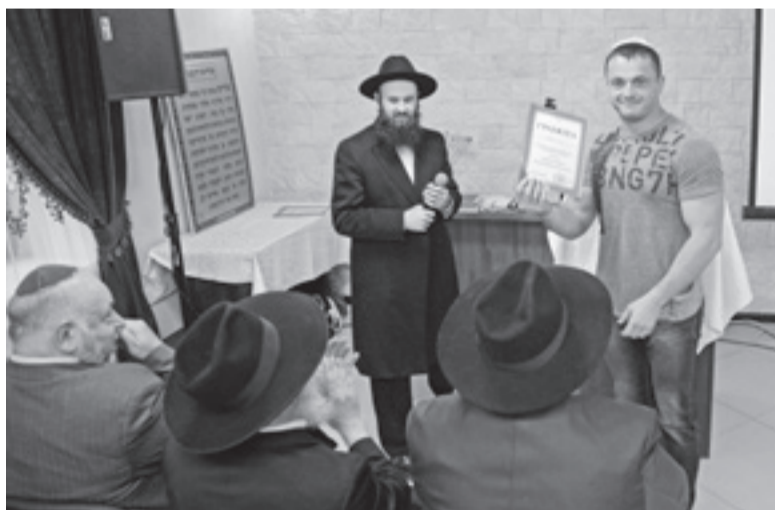
Фото и текст Ирины Кожановской, Караганда

С обретением независимости и благодаря политическому курсу президента Казахстана, действующей власти, с 1990-х годов в республике открыты шесть синагог. Тепло и отранно на сердце каждого еврея, когда совершаются такие великие дела: синагога то место, где собирается община, чтобы проникнуться молитвой Всевышнему и чтить умом и сердцем еврейскую Традицию.