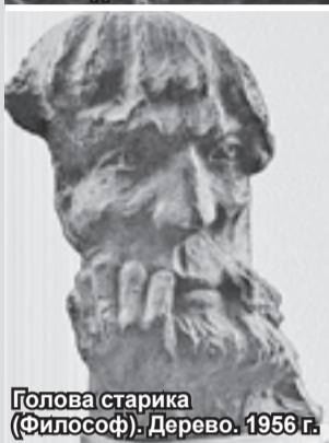
Голова старика (Философ). Дерево. 1956 г.