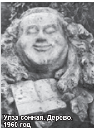
Улза сонная. Дерево. 1960 год