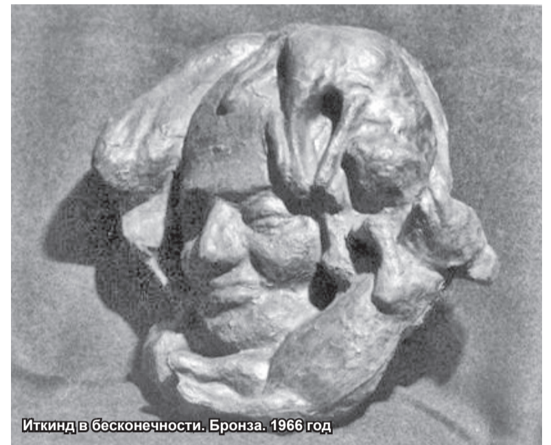
Иткинд в бесконечности. Бронза. 1966 год

В советское время Иткинд становится известным в мире не меньше чем Шагал, его сравнивали с Ван Гогом. О нем писали тогда чуть ли не все газеты, с ним дружили знаменитые писатели и режиссеры – Максим Горький, Владимир Маяковский, Сергей Есенин, Всеволод Мейерхольд, Василий Качалов, его опекали столпы советской власти – нарком просвещения Анатолий Луначарский и первый секретарь Ленинградского обкома партии Сергей Киров. А выставки