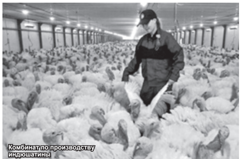
Комбинат по производству индюшатины