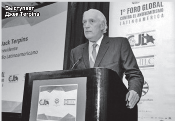
Выступает Джек Терпинс

В столице Аргентины, Буэнос-Айресе, 17 и 18 июля по инициативе Латиноамериканского еврейского конгресса (это региональное отделение ВЕКА, Всемирного еврейского конгресса), прошёл Первый Глобальный форум по борьбе против антисемитизма. Дата собрания не случайна, она совпадает с 22-й годовщиной смертельной бомбардировки здания АМИА – (Аргентино-Израильская Взаимная Ассоциация, еврейский центр в Аргентине), когда в Буэнос-Айресе погибли 85 человек и сотни получили ранения.