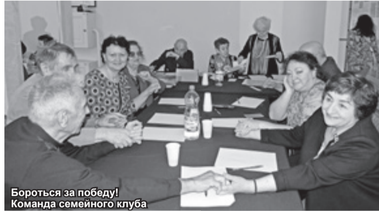
Бороться за победу! Команда семейного клуба