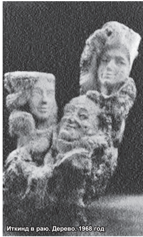
Иткинд в раю. Дерево. 1968 год

- Давайте, реб Мойше, выпьем с вами за двух «недогезанных евгеев», за двух не «гастеленных евгеев», ну, то есть за нас с вами, лэхаим, за «здоговье», значит!