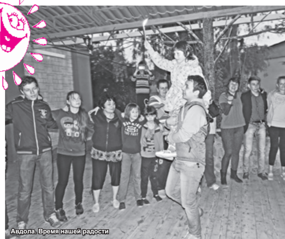
Авдота. Время нашей радости

Любой еврейский праздник, как известно, не обходится без танцев. Мир полюбил ритм и фигуры «Хава Нагилы» — зажигательной пляски, смысл которой в переводе с иврита означает — «давайте веселиться!» Искрометный мотив «Фрейлехса» многие знают как полюбившиеся «7.40». Излюбленная со-