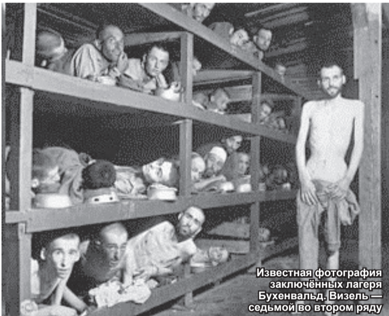
Известная фотография заключённых лагеря Бухенвальд. Визель – седьмой (во втором ряду)

Р.С. Американские конгрессмены предложили установить в Капитолии статую недавно скончавшемуся Эли Визелю – лауреату Нобелевской премии мира 1986 года, узнику концлагерей, борцу с антисемитизмом и нетерпимостью. Автор идеи, республиканец Стив Козн, назвал Визеля «моральным лидером и светочем для Америки и мира». К понедельнику, 11 июля, предложение об установке памятника поддержали 14 конгрессменов, как республиканцев, так и демократов, пишет JTA.